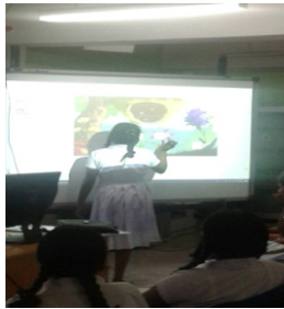
உரு 3: மாணவிகள் திறன் பலகையில் சொற்புணர்ச்சி மற்றும் அவற்றின் வகைகளை இனங்காண்பதற்கு Monster quiz மூலம் பொருத்தமாக இணைத்தல்.