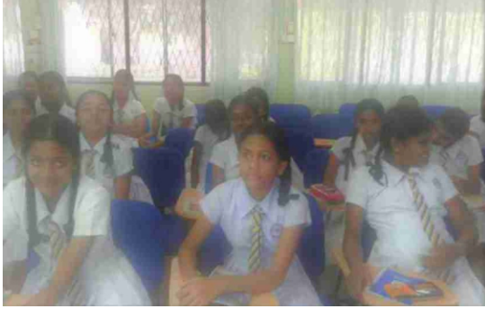
உரு 2: திறன் வகுப்பறையில் மாணவர்கள் ஆர்வத்துடன் கற்றல்