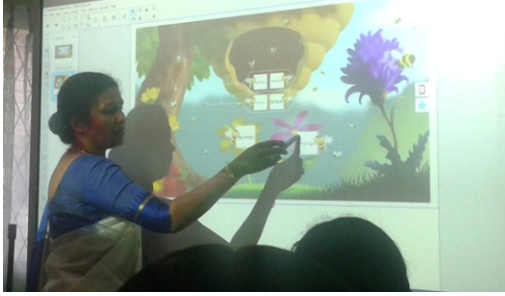
உரு 1: திறன்பலகையைப் பயன்படுத்தி ஆசிரியர் கற்பித்தல் செயற்பாட்டினை முன்னெடுத்தல்